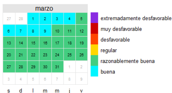
O 3 Marzo 2021